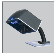
桌上零时支架 MLPN 46-00868