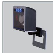
壁挂式支架 MLPN 46-00869