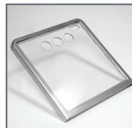
可选额外保护性玻璃窗 MLPN 46-00867